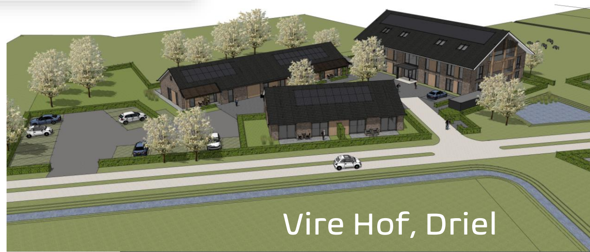
Vire Hof, Driel