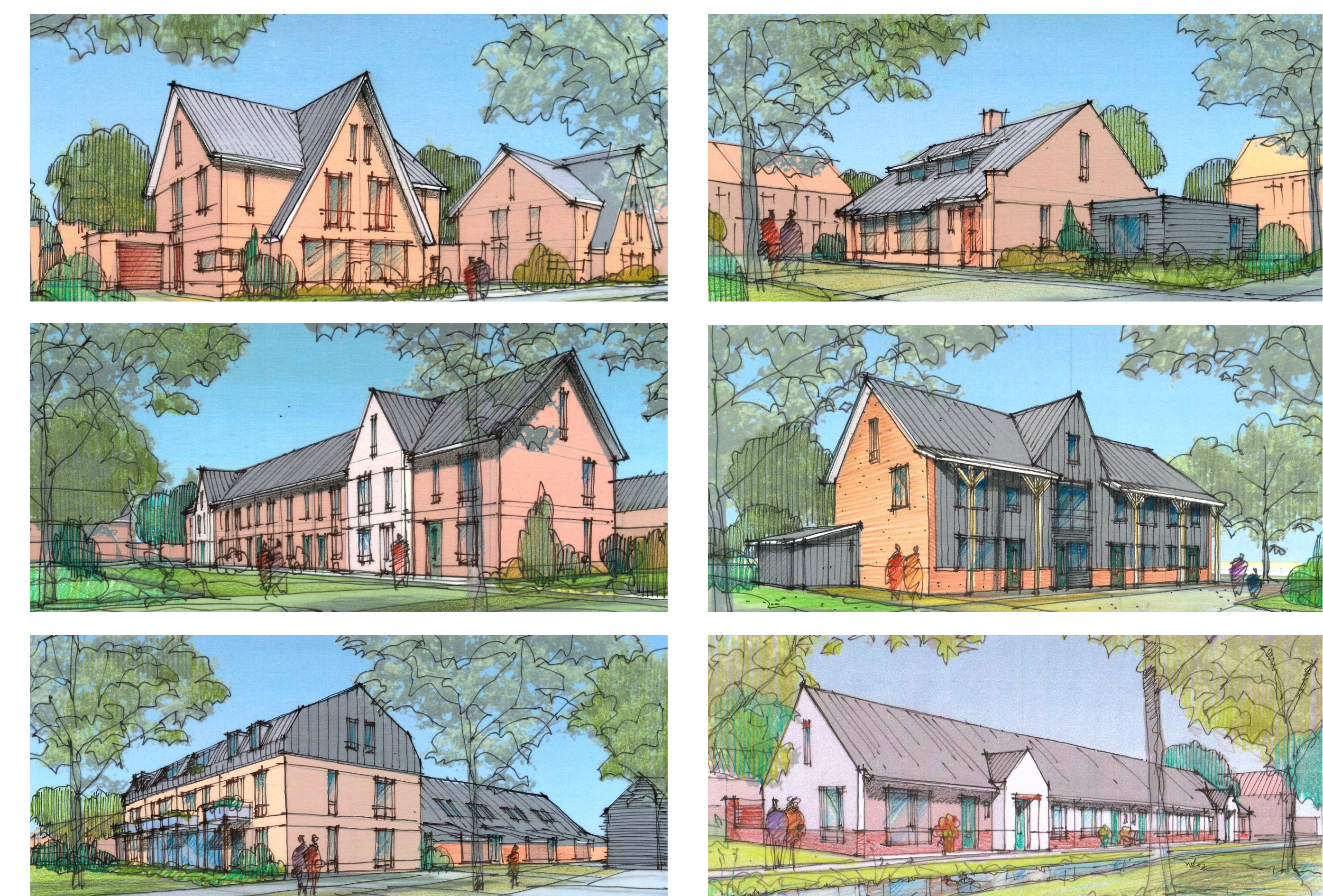
Eerste ontwerpschetsen woningen

Achterberg West Planpresentatie 2 februari 2023