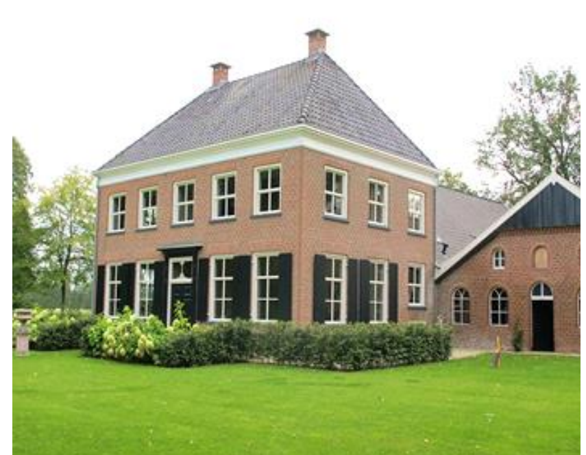
Referentiebeelden / schets