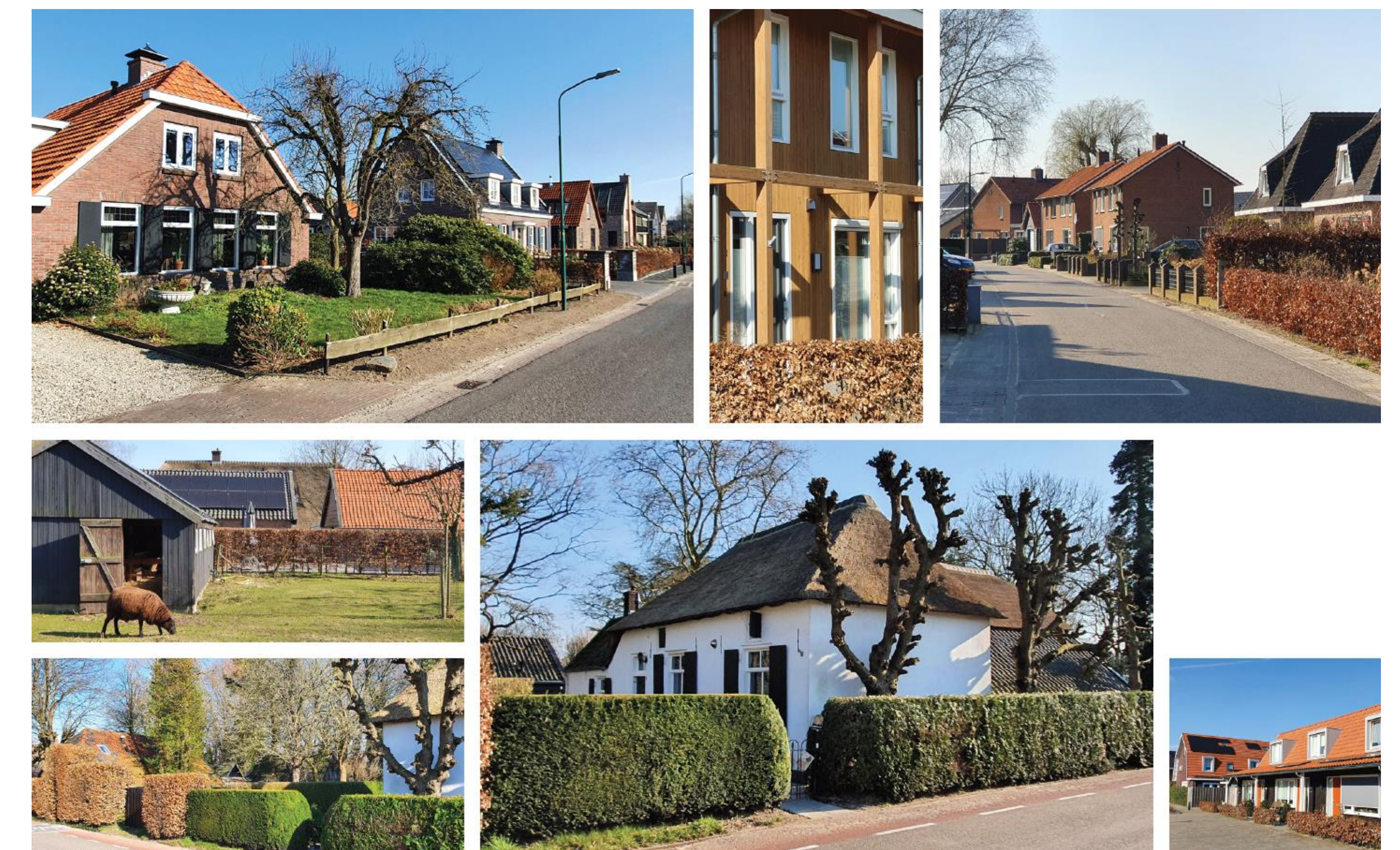
Referentiebeelden dorps kwaliteit