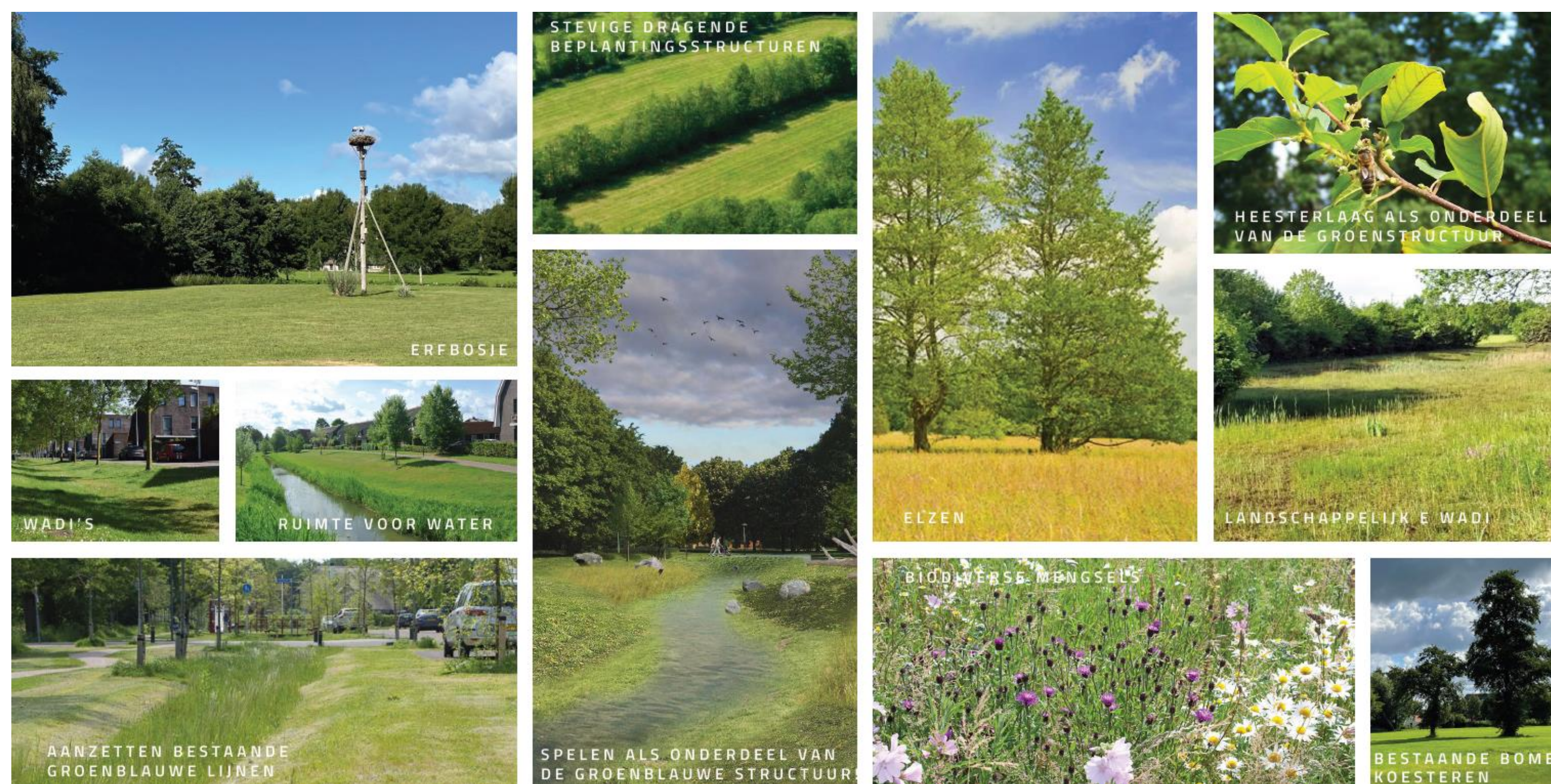
Referentiebeelden groen-blauwe structuur