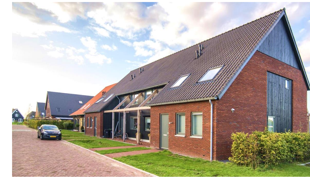
Referentiebeelden / schets